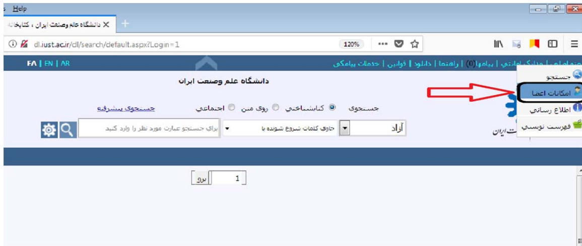
(شکل ۴) امکانات اعضا