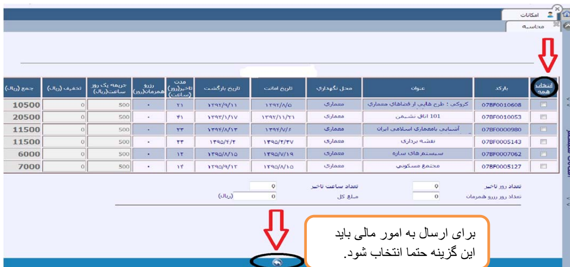
(شکل ۶) انتخاب همه و ارسال مالی