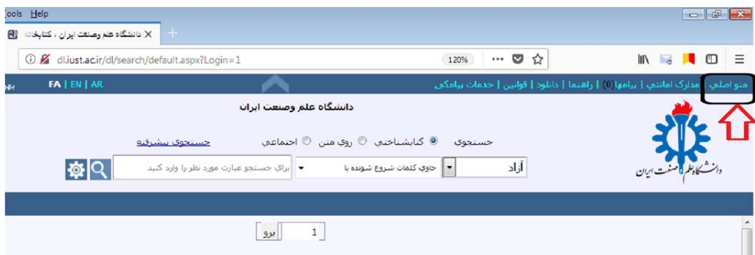
(شکل ۳) منوی اصلی