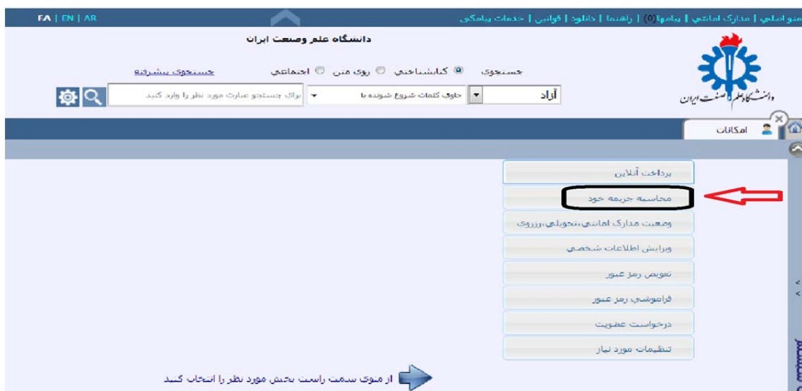
(شکل ۵) محاسبه جریمه خود