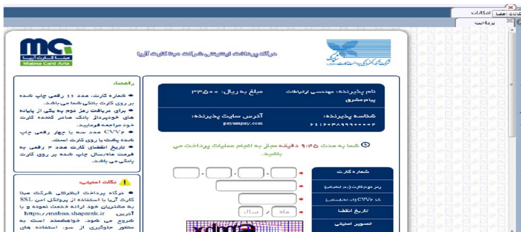
(شکل ۹) اتصال به درگاه بانک