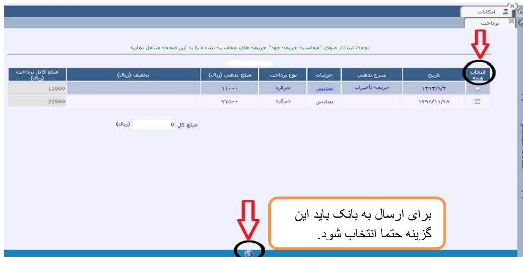
(شکل ۸) انتخاب همه و ارسال مالی