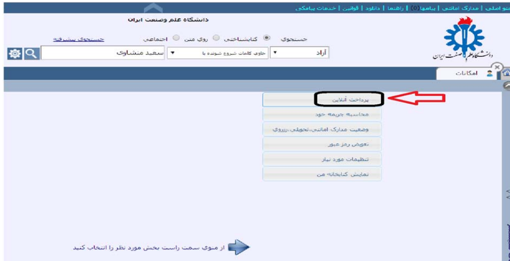
(شکل ۷) پرداخت آنلاین