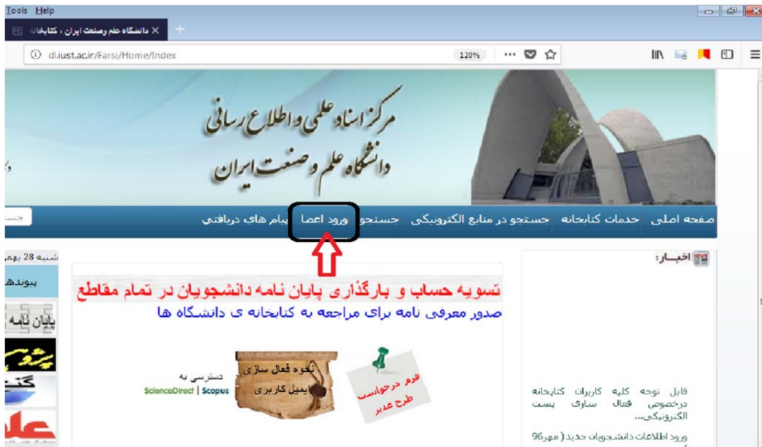
(شکل ۱) ورود به سایت کتابخانه